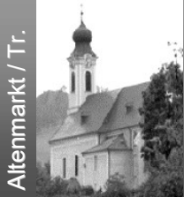
Altenmarkt / Tr.