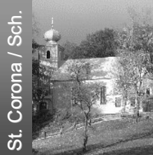
St. Corona / Sch.